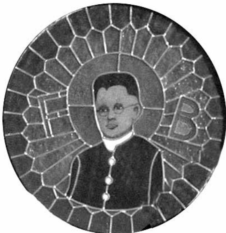
Vitraž iz crkve sv. Stjepana u Krasici