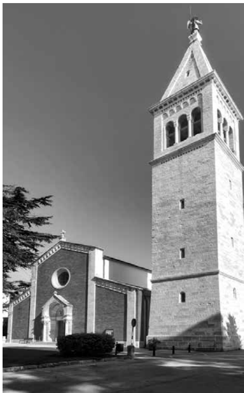
Župna crkva u Novigradu

S prvim danom travnja 1937. započinje službu pomoćnika u službi u Novigradu. 20 Tu ostaje, zajedno s majkom, sestrom Romanom i bratom Giovannijem nešto više od dvije godine. Odmah se uključuje u društveni život tog gradića, među ribare, pomorce, zemljoradnike i male zanatlije. Zdušno se zalaže za mlade, naročito u katehizaciji. Obraća se jednostavno župljanima, posjećuje bolesnike, starce i seljake po okolnim kućama. Svima se stavio na raspolaganje. Pomaže siromasima malenim ekonomskim i praktičnim pomoćima. Oko njegove ispovjedaonice okupljaju se mornari, seljaci, kao i oni koji žele izvanredna ispovjednika pa se čulo da ljudi govore: