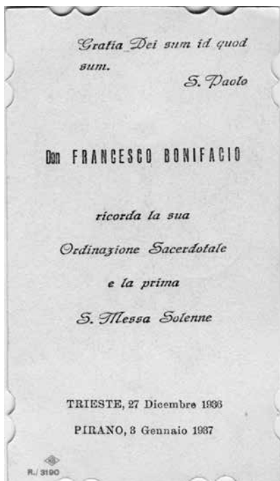
Spomen-sličica sa svećeničkog ređenja i mlade mise bl. Francesca Bonifacija