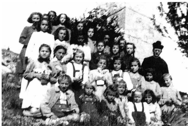
Članice Katoličke akcije u Krasici 1943. godine

Želite li znati kakva će biti vaša smrt, ispitajte zato svoj život!